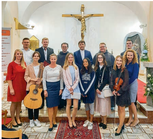
Na poslednej svätej omši si uctili misijný kríž a rozlúčili sa s pátrami, ktorí zanechali krásne spomienky na misie vo farnosti.

Pri utorkovej svätej omši sme si spoločne obnovili krstné sľuby a očistili sme sa v krstnej vode. Poobede bol program pre deti aj so svätou omšou.