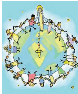
Deti sa modlia ruženec za mier v sýrskom Aleppe, 2021.

Minulý rok sa deti modlili pod osobitným patronátom svätého Jozefa, ktorý nám slovami pápeža Františka pripomína, že „všetci tí, čo sú zdanlivo skrytí alebo sú ‚v tieni‘, môžu v dejinách spásy zohrávať nenahraditeľnú úlohu“.