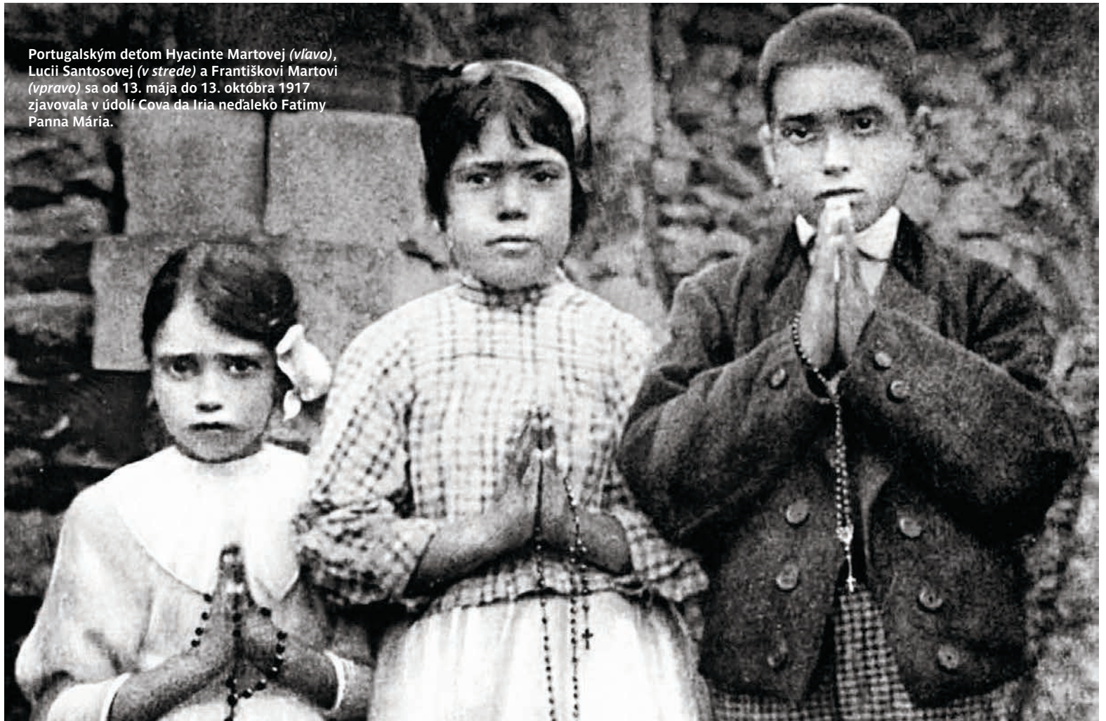
Portugalským deťom Hyacinte Martovej (vľavo), Lucii Santosovej (v strede) a Františkovi Martovi (vpravo) sa od 13. mája do 13. októbra 1917 zjavovala v údolí Cova da Iria neďaleko Fatimy Panna Mária.

Sedemročná Hyacinta, deväťročný František a o rok staršia Lucia. Tri deti, ktoré si v roku 1917 vytrpeli urážky, zosmiešňovanie i obety, aby cez ne Panna Mária odovzdala svetu veľké posolstvá. Dve z nich sú už sväté, sestra Lucia čaká na blahorečenie.