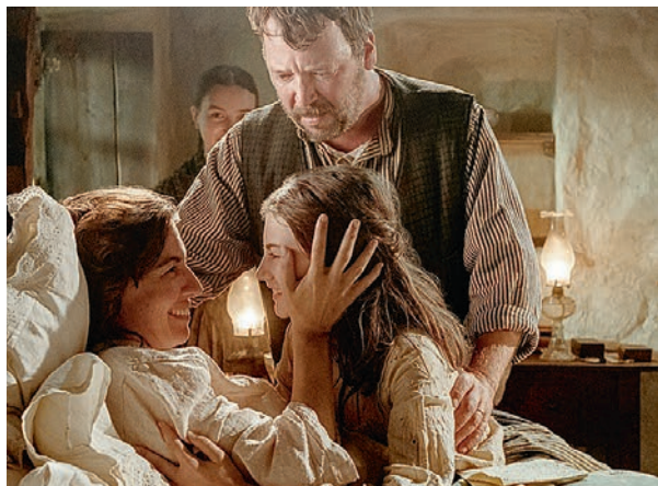
Mama, otec a dcéra Santosovci v jednej z dojímavých scén.