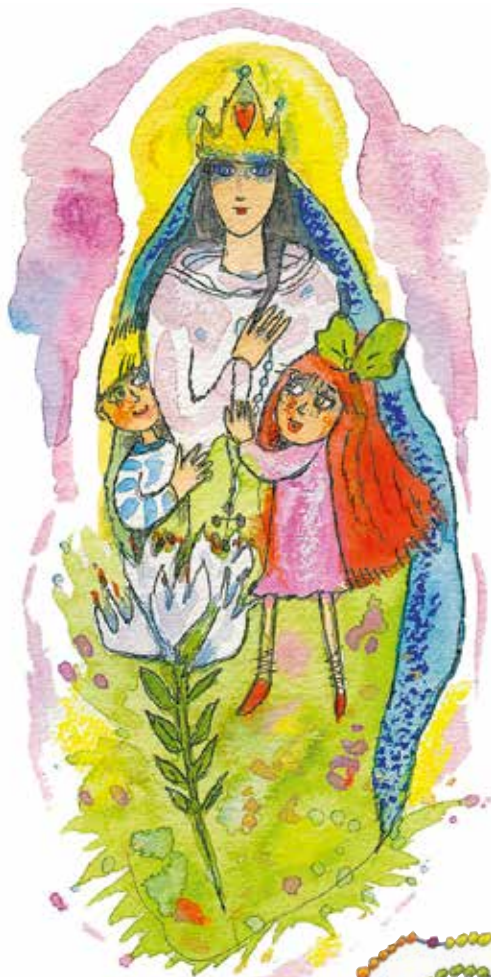
Panna Mária, Pomocnica kresťanov, oroduj za nás!