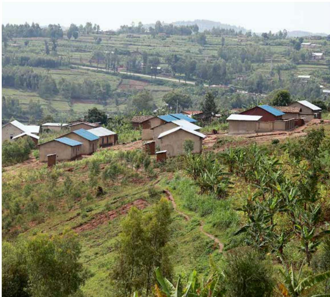
Väčšina obyvateľov Rwandy má svoje jednoduché hlinené obydlia postavené na kopcoch. Okolo domov majú políčka, ktoré im vďaka vynikajúcej klíme prinášajú úrodu aj dvakrát do roka.